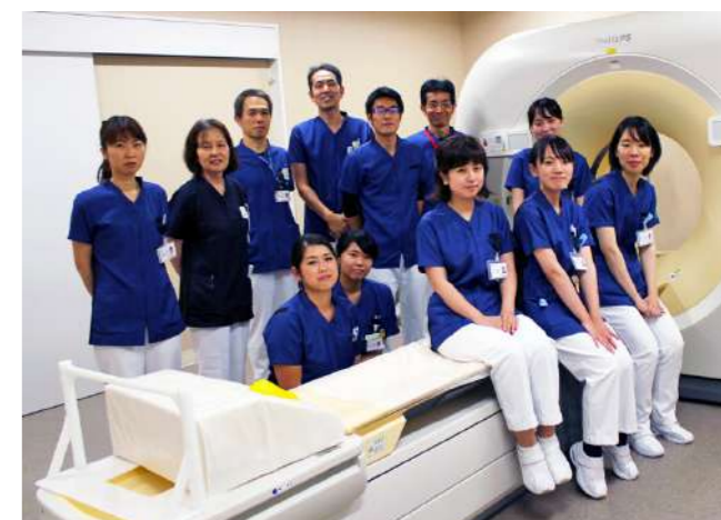
放射線科生理検査室 スタッフの皆さん

当院は熊本市中央区に位置し、2017 年 4 月に病院が新築され、2017 年 6 月には 95 周年を向かえました。新病院では診療機能のさらなる充実を図ると共に、より高度な医療の提供を目標としています。地域医療機関との連携から、施設での急変や在宅療養中の高齢者の救急対応のバックアップ病床まで、都心部における総合病院機能を持った在宅支援病院として、急性期から在宅医療までの切れ目のない医療を提供していきたいと思っています。