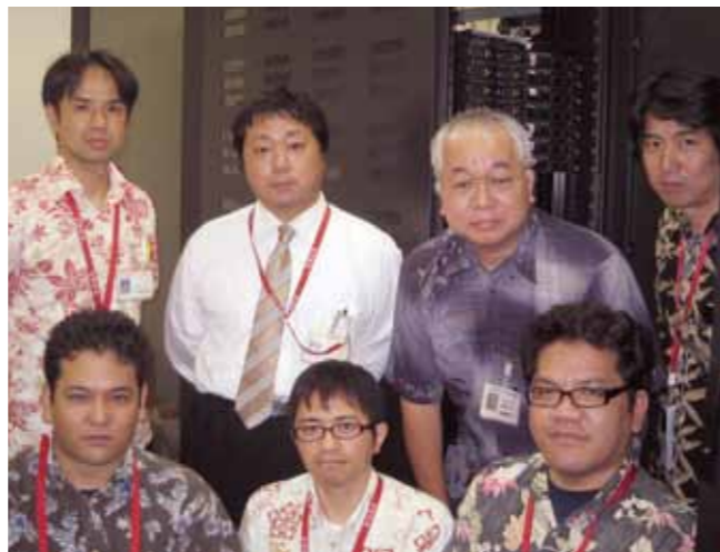
医療情報科の皆さん

また、放射線科では RIS と PACS の連携により、検査時に RIS から STELLAR を起動させることで、患者検索やドキュメント検索の手間が一切なくなりました。やはり、迅速かつ慎重に検査を行う放射線科においては、RIS 機能の充実も大切ですが、検査に関する情報収集に患者様を待たせることなく、自分の目で確認できることの便利さは大変有難く感じています。