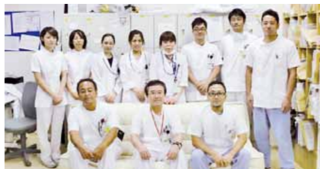
放射線科の皆さん

診療においては、STELLAR で検査画像のサムネイルと検査データの数値が時系列で確認ができ、NazcaView で簡単に過去比較が行えますので作業能率が向上しました。