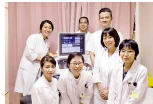
生理検査室の皆さん

アストロステージの強みはフットワークの良さと、ユーザ目線で考えてくれる事だと思います。いつまでもその良さを忘れずに、機能改善や新機能を開発して頂く、日々ステップアップして欲しいと思っています。