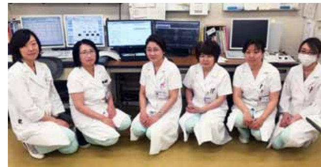
生理検査室のスタッフの皆さん

今までは様々なシステムを使用していたため、使用・参照する際に別々のアプリを起動しなければならぬという手間がありました。それに代わりSTELLARでは文書システムとしての使い勝手に加え、画像や診療データなどを含めて参照する事が出来ることによりシステムの簡素化が行え、業務の効率化を図れるところにメリットを感じ導入を決定しました。