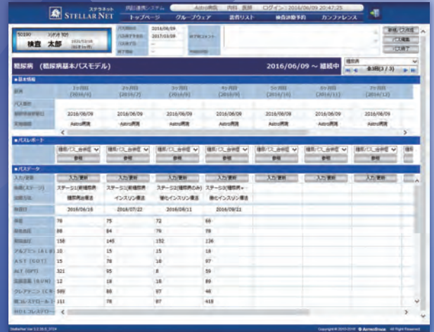
地域連携クリティカルパス

地域連携システム STELLAR NET (ステラネット) は、単なる診療情報の WEB 公開だけではなく「地域連携パス」や外部からの「検査・診療の予約・受付」を併せて行える、地域医療連携に必要な機能をトータル的にもつシステムです。病院ごとのシステムに依存しない「病診間をオープンに連携できる」自由度の高いシステムとなっているため、院内の診療情報の共有からその診療情報の地域での共有化までを実現します。