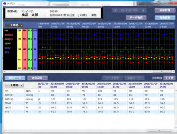
生体モニタの集中表示