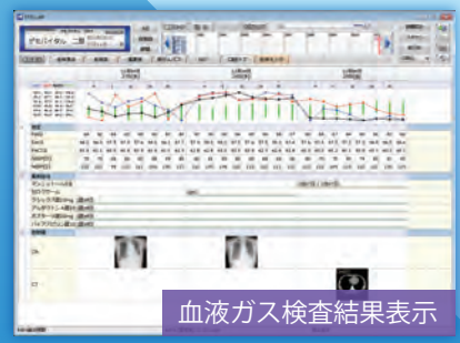
血液ガス検査結果表示