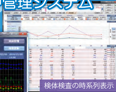
検体検査の時系列表示